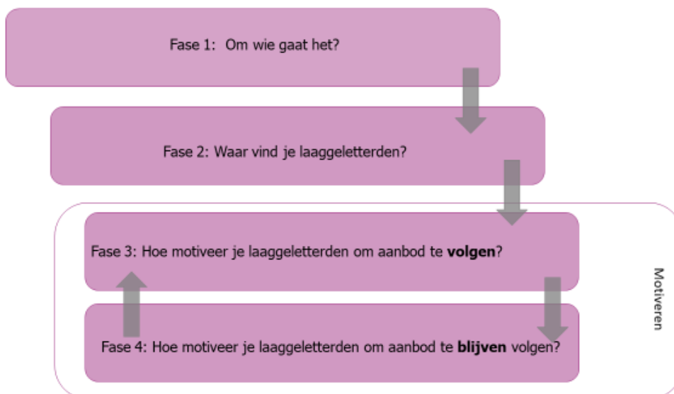
Figuur 3.1 Wervingsproces laaggeletterden

Het motiveren van laaggeletterden om gebruik te maken van educatieaanbod, is een onderdeel van het wervingsproces van laaggeletterden. Dit proces is in figuur 3.1 schematisch weergegeven.